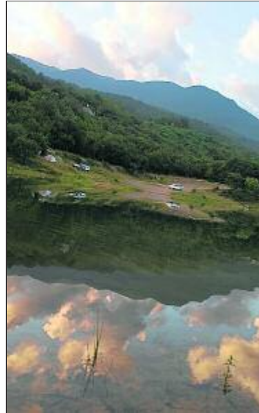
Beeindruckende Berglandschaften in der Ukraine.