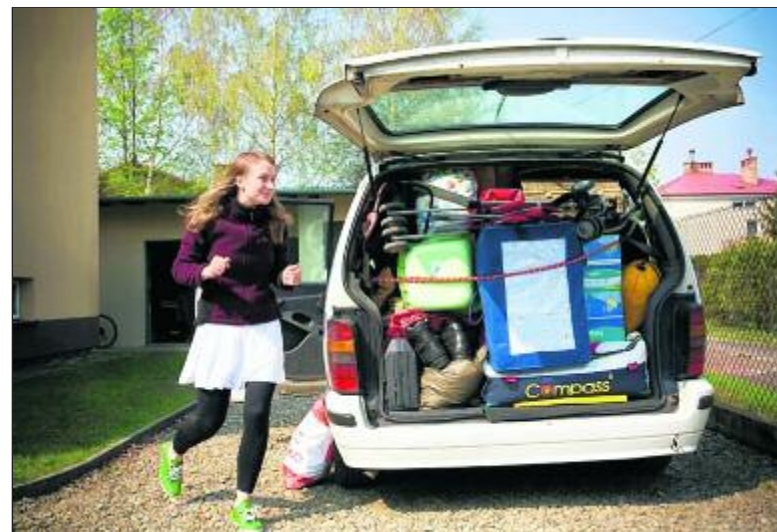
Der Renault ist vollgepackt, die Reise kann beginnen. Kurz vor dem Ende der Tour gab der Wagen, Baujahr 1992, jedoch seinen Geist auf.